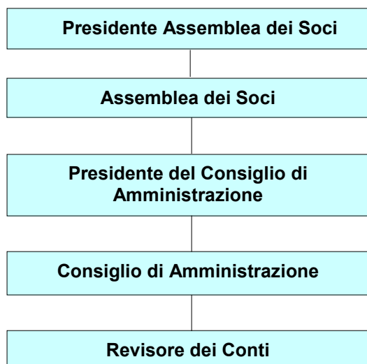
Grafico 2 – Gli Organi dell'ASP AMBITO 9