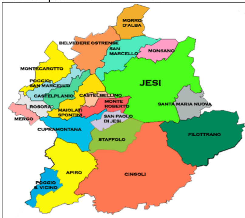
Grafico 1 – Il territorio di competenza dell'ASP AMBITO 9